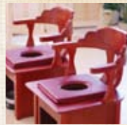
よもぎ蒸し専用椅子