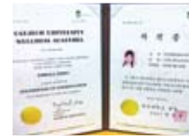
韓国大田大学校 美容アカデミー 「美容成形小顔療法」指導者資格証